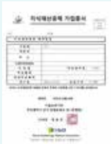
혁신특허사업화지원사업 수혜기업 선정 공문